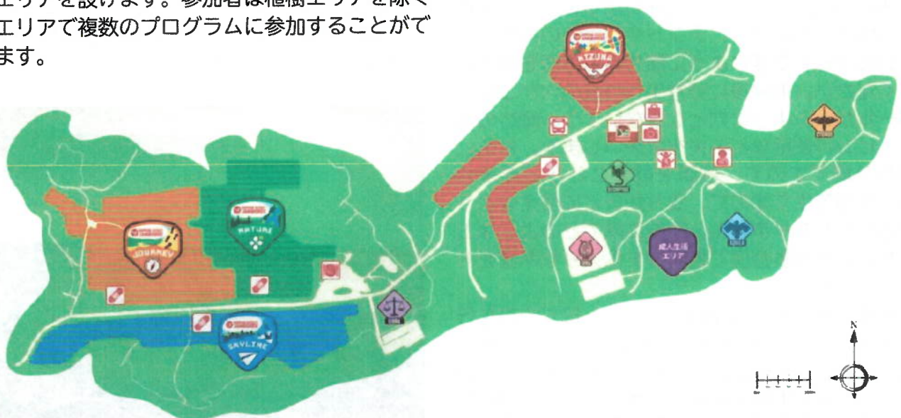
会場マップ2026年4月時点